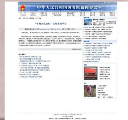
中华人民共和国国务院新闻办公室2012